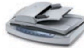
HP Scanjet 5590

Ideal para empresas que requieren versatilidad y resultados de alta calidad, con capacidades de digitalización de múltiples páginas.