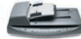
HP SCANJET 8250

Ideal para empresas que manejan grandes cantidades de digitalización de imágenes y documentos.