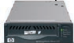
Unidades de cinta Ultrium

Ofrecen el más alto nivel de capacidad, confiabilidad y rendimiento y permiten respaldar masivas cantidades de datos en sólo horas. Son ideales para proteger los datos de toda la empresa, especialmente en ambientes de cómputo con tiempos de respaldo limitados. Todas las unidades incluyen ODBR 1 .