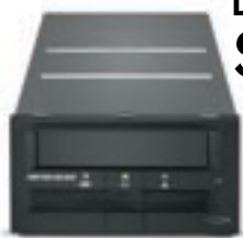
Unidades de cinta DLT

Son la solución ideal para empresas con servidores de rango medio y a gran escala, que requieren proteger sus datos con una solución confiable que ofrece excelentes velocidades de transferencia de datos y conectividad flexible. Todas las unidades incluyen ODBR 1 .