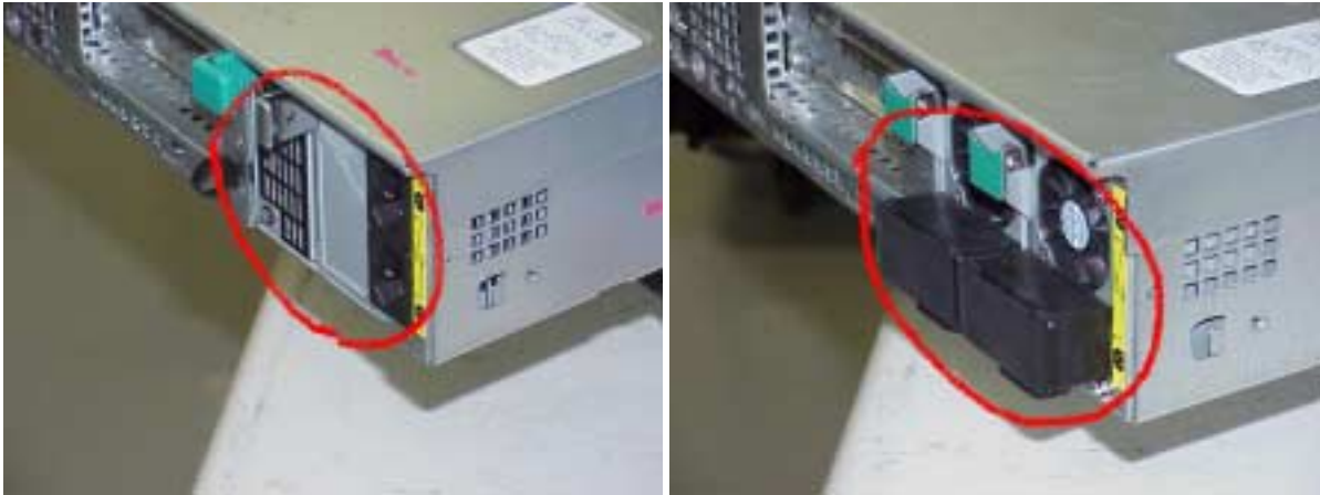
Рис. 1 Корпус с блоком питания постоянного тока (справа) и корпус с блоком питания переменного тока (слева).

При транспортировке серверного корпуса Intel® SR2300 при питании от источника постоянного тока необходимо модифицировать упаковочный материал корпуса, чтобы в него помещались корпус блока питания и модуль питания. На рисунках ниже изображен корпус до и после модификации.