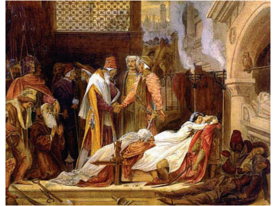
Frederic Leighton, La reconciliación de los Montesco y los Capuleto (1854)

http://shakespeare.cc.emory.edu/illustrated_showimage.cfm?imageid=134