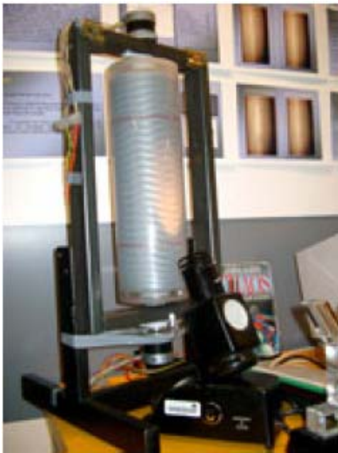
O equipamento tem dois cilindros giratórios independentes

Trabalhando com o professor de física de sua escola, primeiro ela tentou construir um equipamento com o qual pudesse estudar a turbulência em laboratório. No entanto, o primeiro dispositivo não apresentava o controle preciso necessário, então ela consultou cientistas de uma universidade próxima onde seu pai leciona geologia.