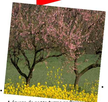
A árvore da nossa turma na Primavera

Agora que é primavera, nossa árvore está cheia de flores!