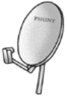
TV Çanak Anten