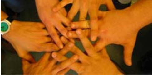
Toplum için Çalışanlar